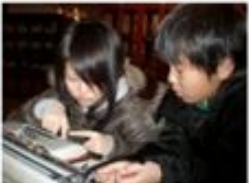
北大の資料館に行ってきました。