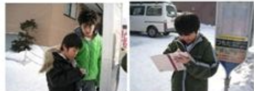
光くんが小3の社会の授業を手伝っていた時の様子。光くんにはビジョンが与えられました。