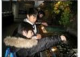
水族館や青少年科学館にも行って来ました。